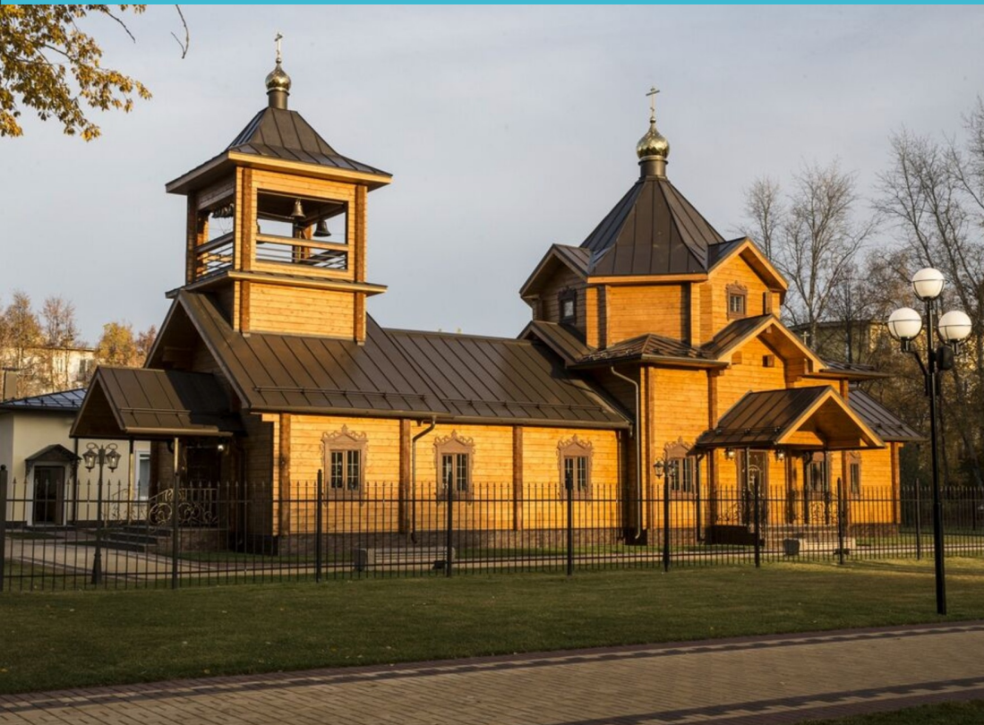
Храм Георгия Победоносца МО, пгт Чехов 3