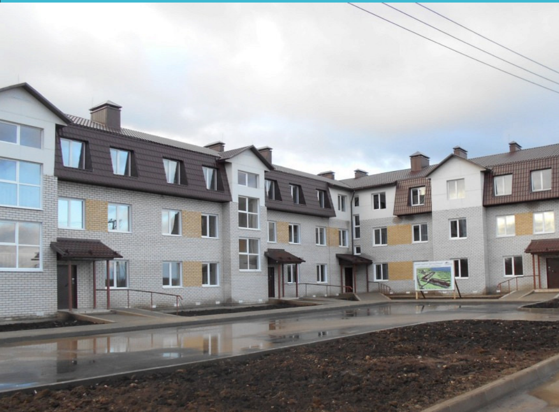
Многоквартирный дом ЛСТК Вологодская обл, г. Белозёрск