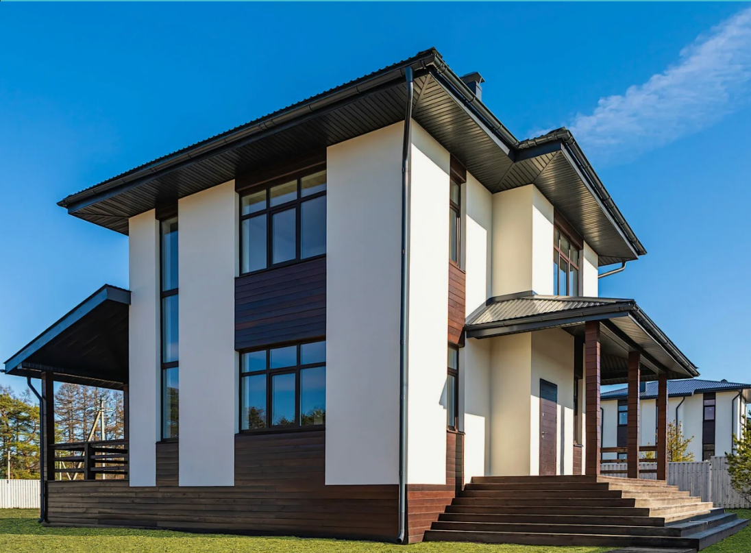
Коттеджный посёлок «Белая Руза» МО, п. Бородёнки