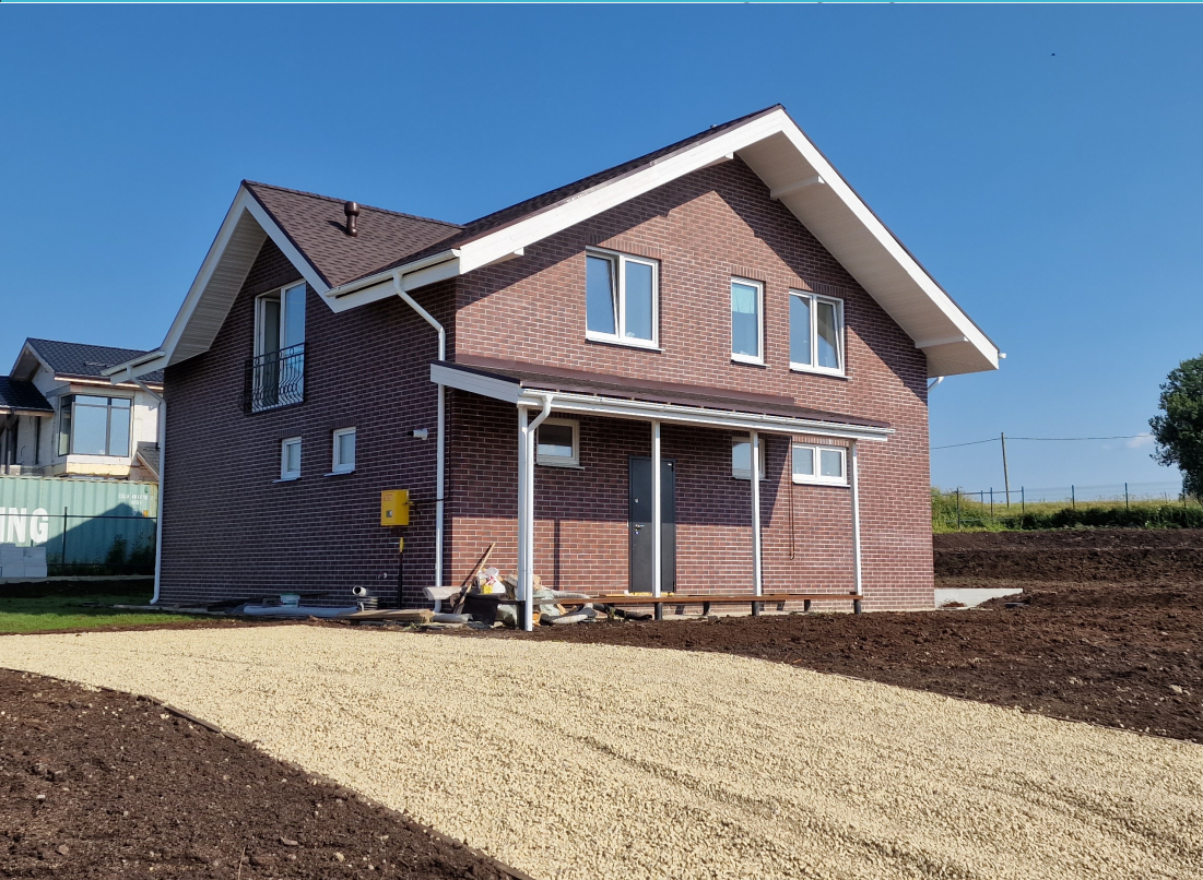
Малоэтажное строительство ИЖС Ленинградская область